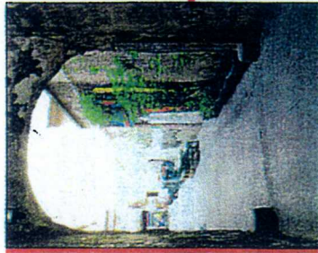
2003 Bei der ersten Auktion kommt kein Gebot fürs Haus Schwarzenberg.