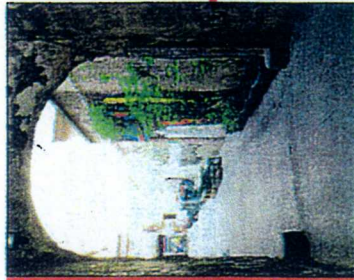
2003 Bei der ersten Auktion kommt kein Gebot fürs Haus Schwarzenberg.